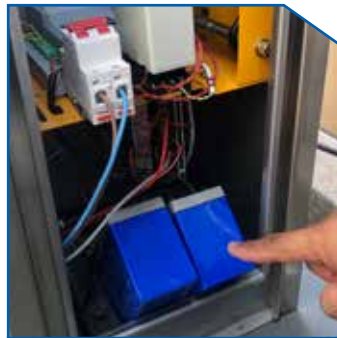
Backup battery keeps barrier running while power off