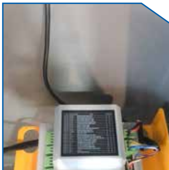
Multi-Function Control System with LED Display