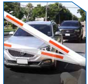
Barrier gate swing out and auto-reverse on obstacle, Protect barrier gate and car.