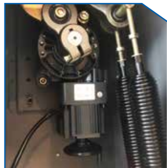
DC Motor 24V DC Motor