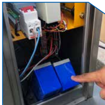
Backup battery keeps barrier running while power off